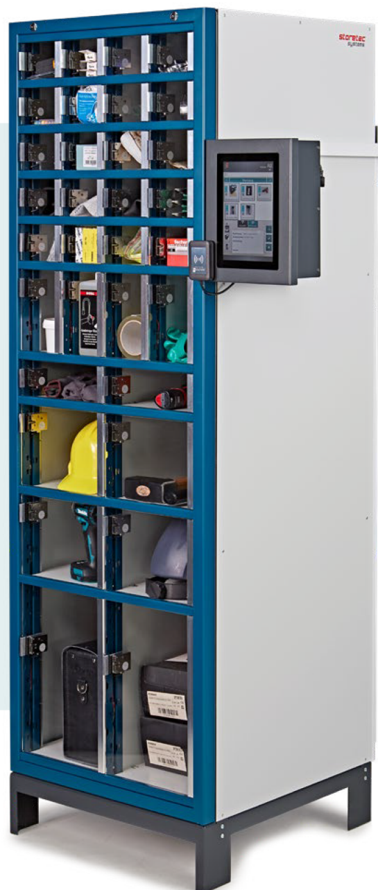
Das ETT BASIC Modul lässt sich einfach seitlich an einen Automaten montieren