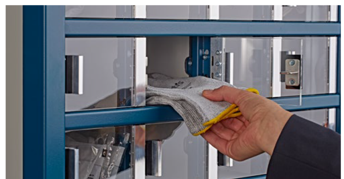
Diverse Fachgrößen für unterschiedliche Produkte