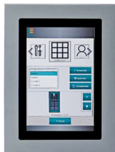
Konfigurationsmenü für Administratoren