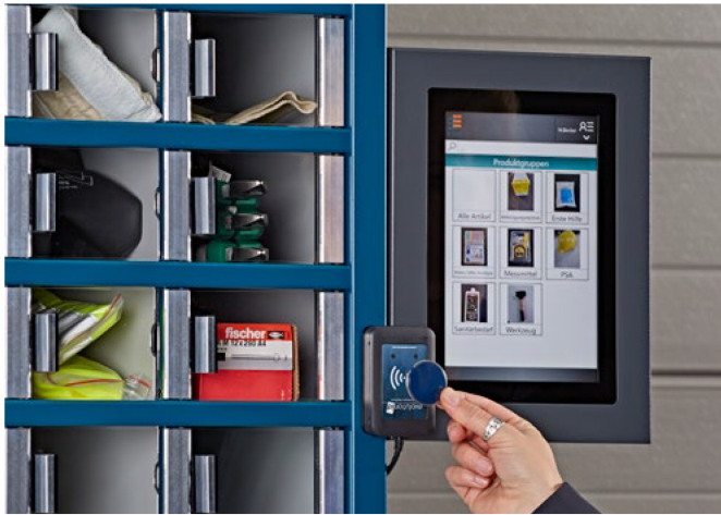
Anmeldung mit RFID-Chip, Produktgruppenübersicht

Unser neues Programm deckt den immer größer werdenden Bedarf an schnell verfügbaren, wirtschaftlichen Ausgabeautomaten ab, die für eine Vielzahl von Produkten geeignet sind: Werkzeuge, Arbeitsschutz, Industriebedarf und vieles mehr.