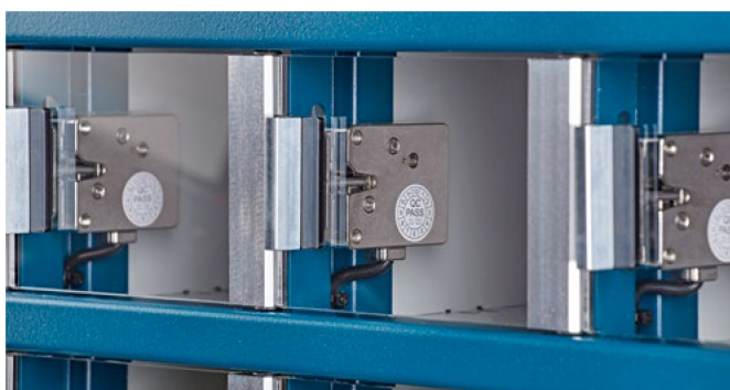
Der ETT BASIC verfügt über langlebige Verschlussmechanik

RFID-Reader und 2D-Reader für Barcodes und QR-Codes sind als Zubehör lieferbar.