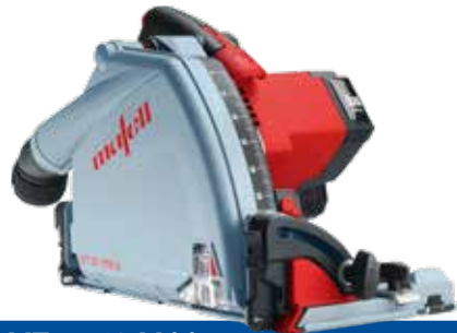
MT 55 18 M bl