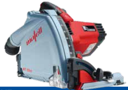
MT 55 cc