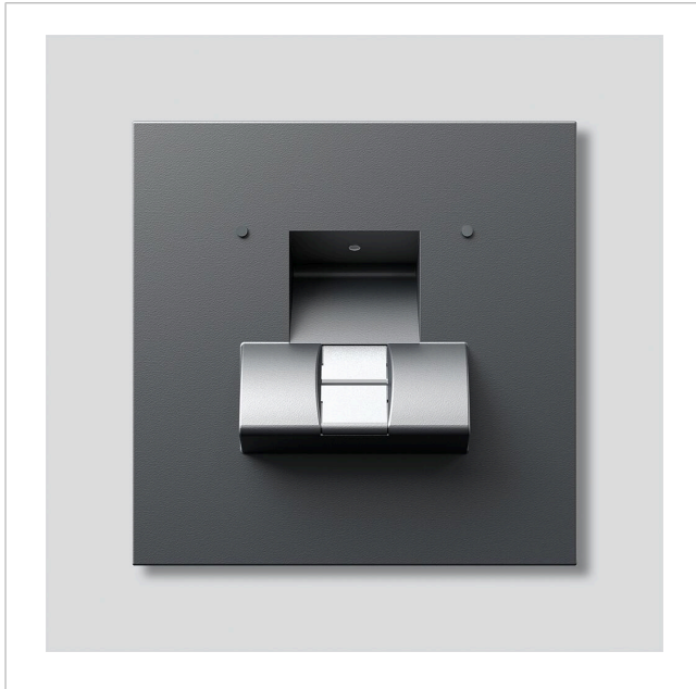
Fingerprint-Modul FPM 600-0 DG 210009609-00