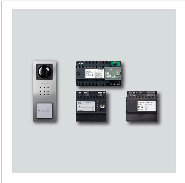
Starter-Set Smart Gateway für Aufputz SET CVSG 850-1-01