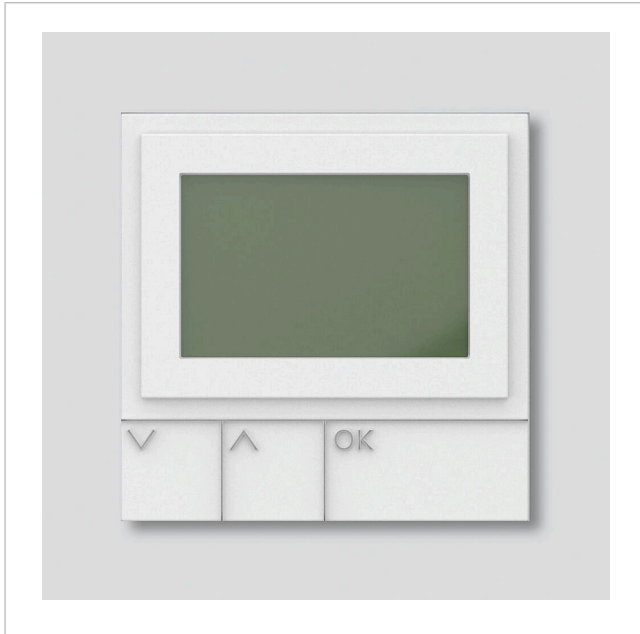
Display-Ruf-Modul DRM 612-02 W