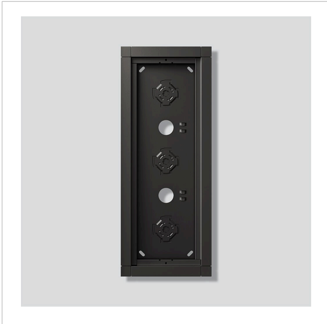
Gehäuse-Aufputz GA 612-3/1-01 DG