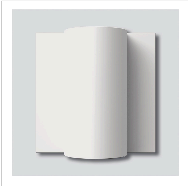
LED-Spot LEDS 600-0 W 200036615-00