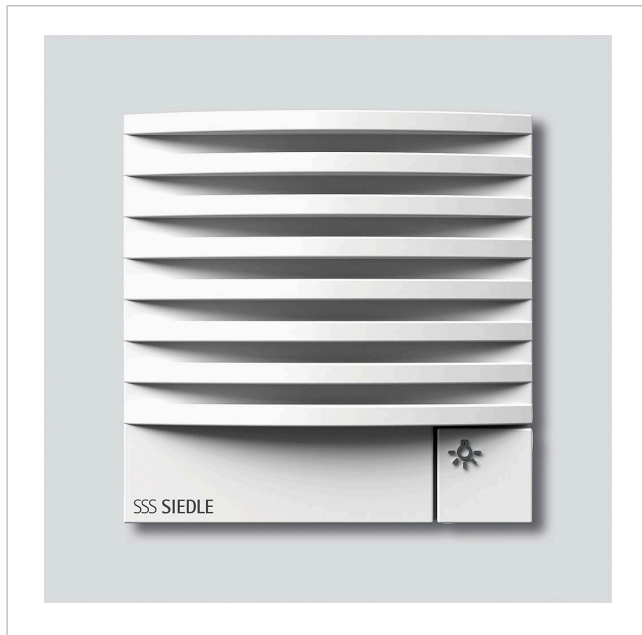
Access-Türlautsprecher-Modul Plus ATLM 671-0 W 210007344-00