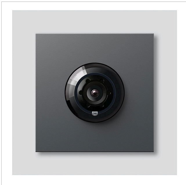
Bus-Kamera 180 für Siedle Vario BCM 758-0 DG 210012155-00