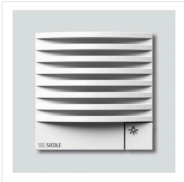
Bus-Türlautsprecher-Modul Plus BTLM 651-0 W 210007339-00