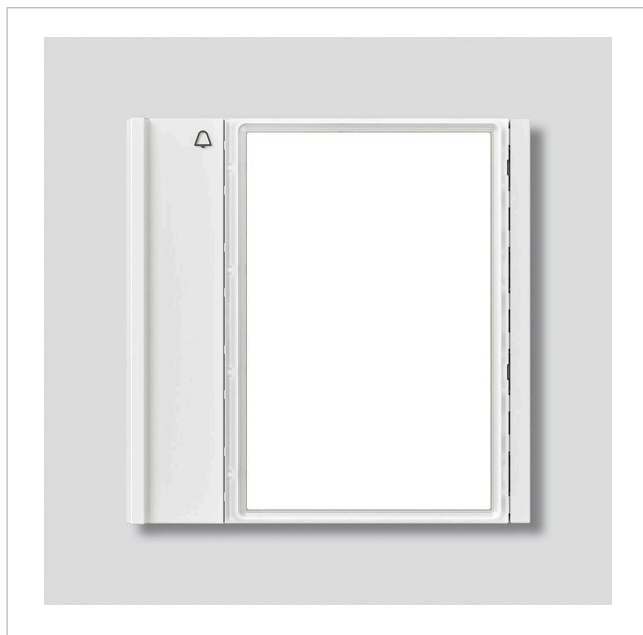
Ruftasten für Siedle Vario TM 700-1-0 W 210011966-00