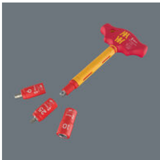
Der VDE-isolierte Quergriff-Adapterschraubendreher 410 i VDE A RA darf nur mit den 1/4" VDE-Bitnüssen und -Steckschlüsseinsätzen der Wera Zyklop VDE Serie 8740, 8760, 8767 und 8790 eingesetzt werden.