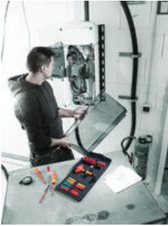
Das Griff/Wechselklingen-System - Kraftform Kompakt VDE