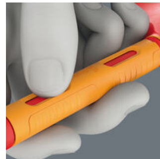
Die Aussparungen in der Freilaufhülse erlauben es, durch Fingerkraft einen Widerstand zu erzeugen. Dies ermöglicht es, die Ratschenmechanik auch bei geringem Schraubwiderstand zu nutzen.