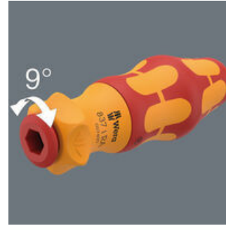
Die integrierte Ratsche mit Feinverzahnung (40 Zähne und ein Rückholwinkel von 9°) vereinfacht und beschleunigt das Schrauben ohne mühsames Neuansetzen.