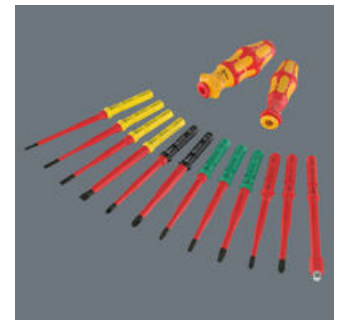
Die 157 mm langen Wechselklingen sind passend für Wera Kraftform Kompakt Griffe mit 9 mm Innensechskant-Aufnahme.