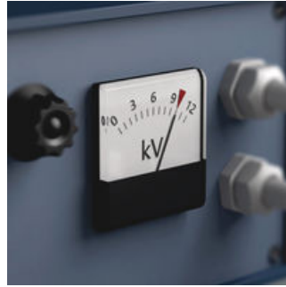
Die Stückprüfung bei 10.000 Volt gemäß IEC 60900 garantiert sicheres Arbeiten unter Spannung bis 1.000 Volt.