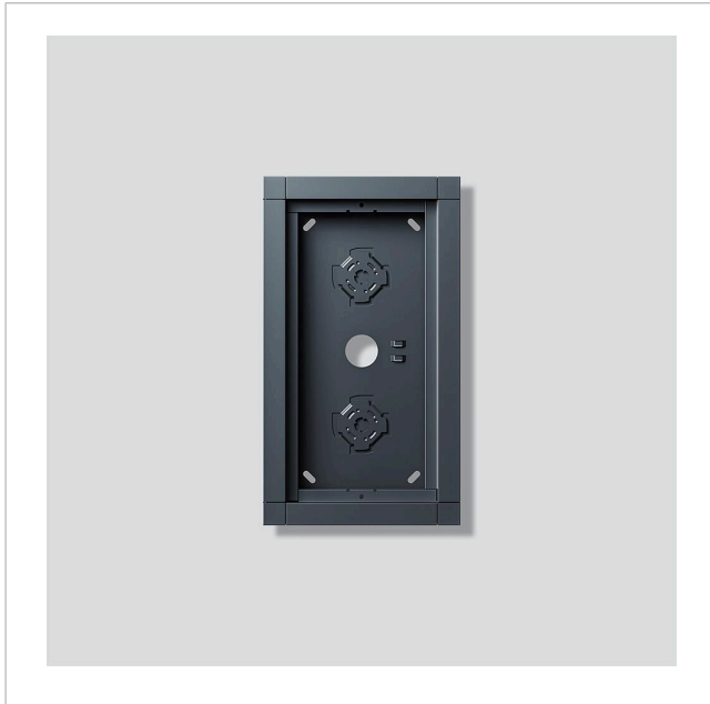
Gehäuse-Aufputz GA 612-2/1-01 AG