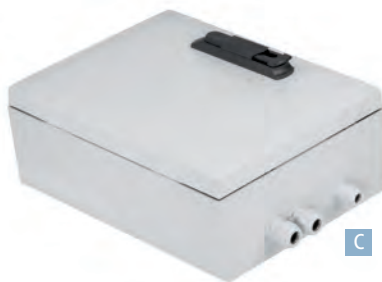
Robustes Gehäuse mit drei Kabeleinführungen und Schwenkhebel