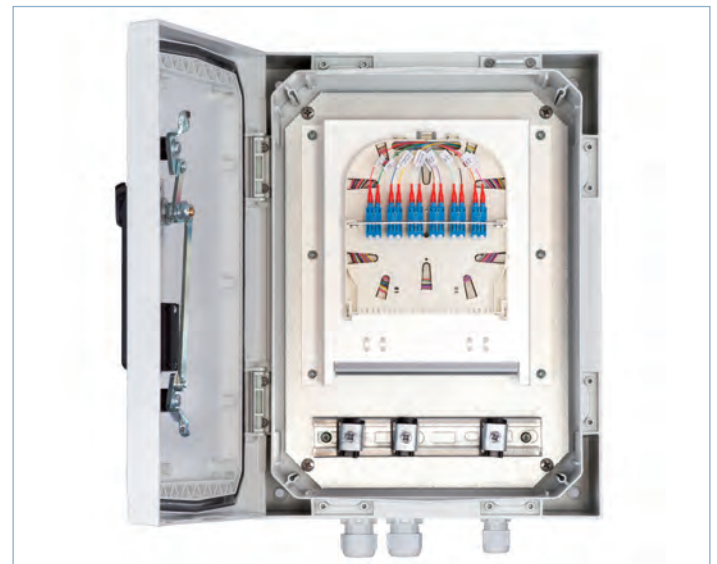
RDB bestückt mit 6 LC Duplex Kupplungen und 12 OS2 Pigtails

Für die Befestigung an Signalmasten ist eine Adapterplatte verfügbar, die an den Verteiler optional angebracht werden kann.