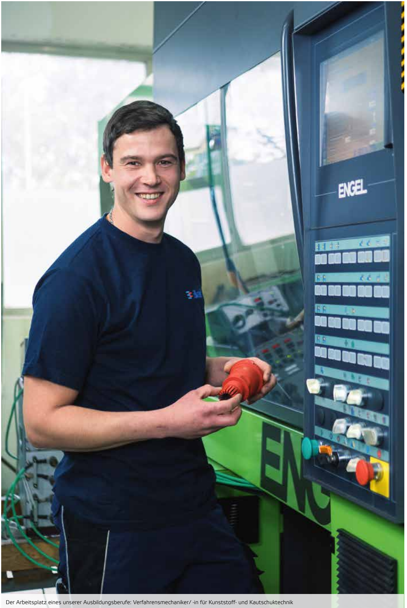
Der Arbeitsplatz eines unserer Ausbildungsberufe: Verfahrensmechaniker/-in für Kunststoff- und Kautschuktechnik