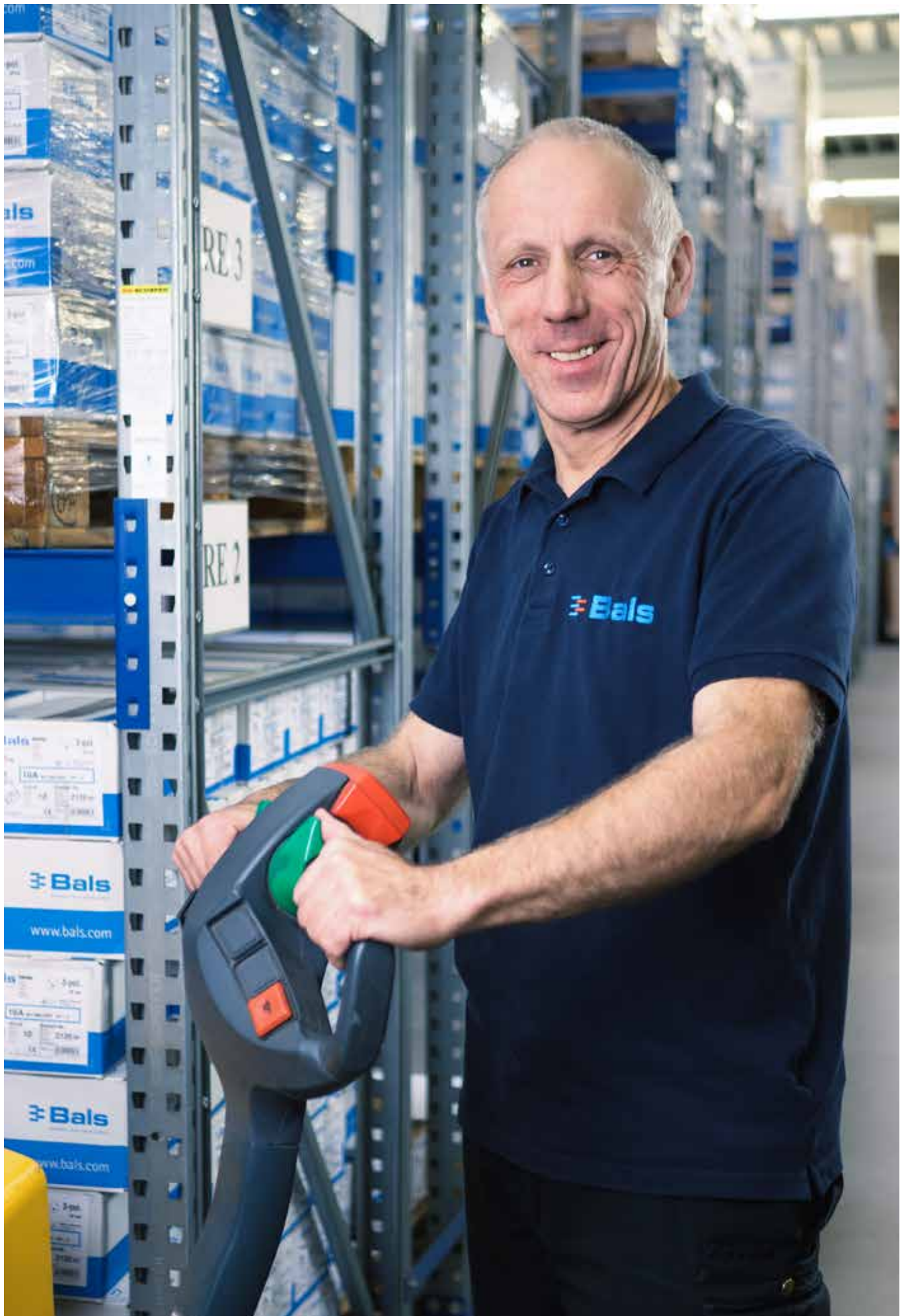
Motivierte Mitarbeiter sorgen für Ihre Zufriedenheit.