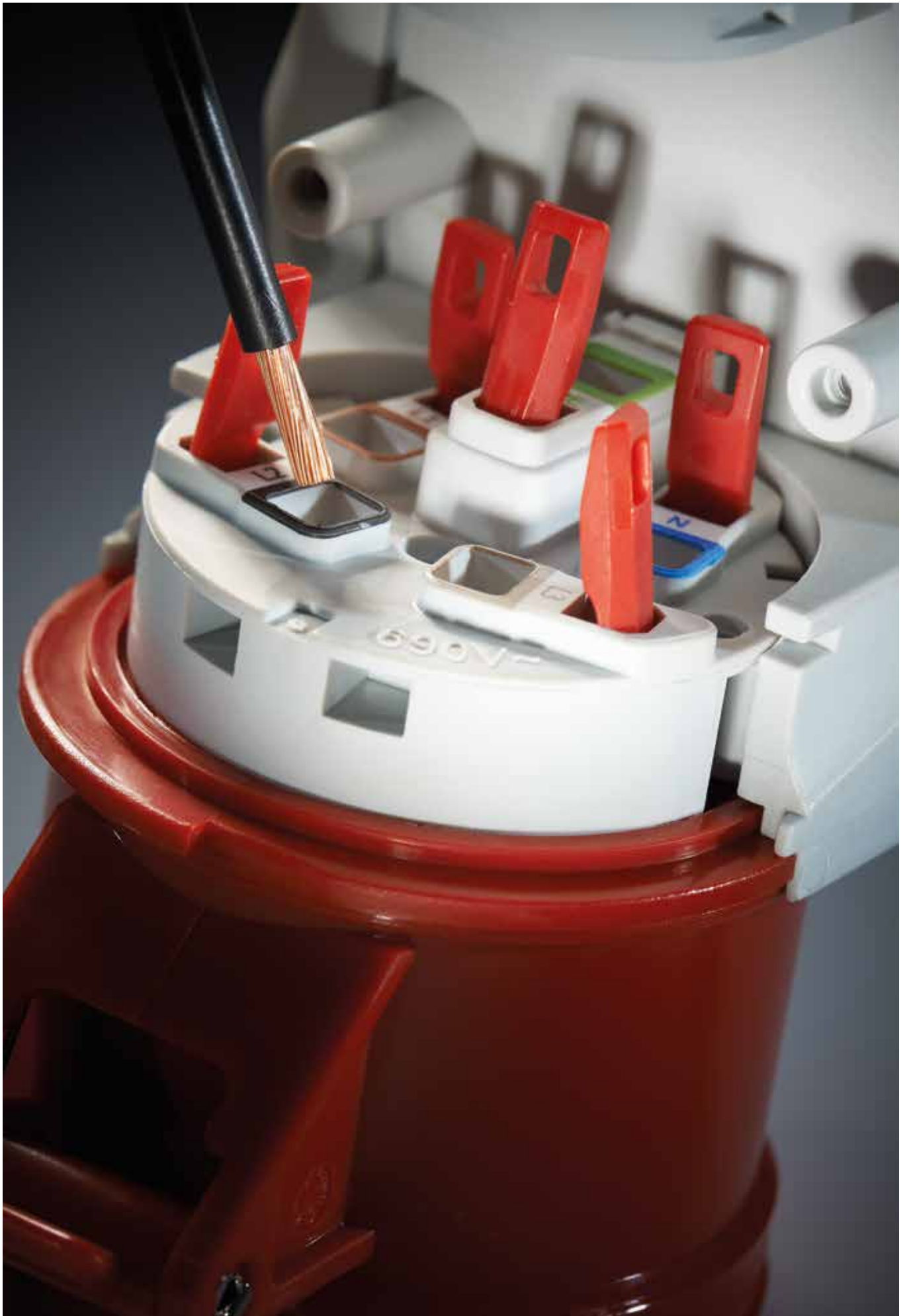
Das QUICK-CONNECT-System von Bals.