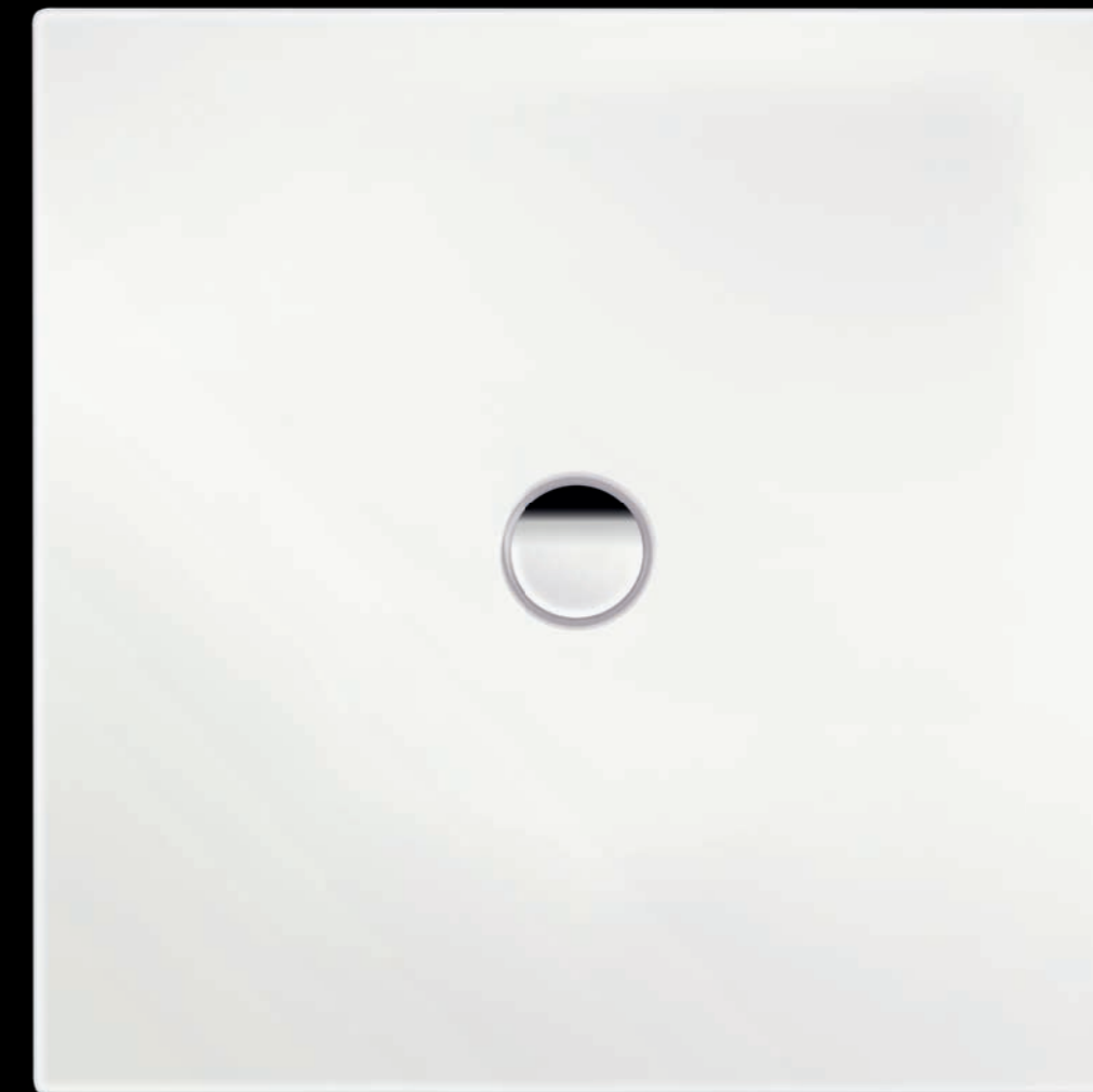
SCONA (modèle n° 913) en blanc alpin.